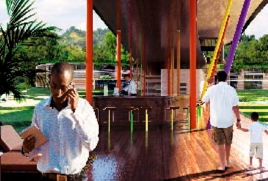
Deutsches Design Ein Business-Hotelresort (Konferenzsäule, Spa, Tennisplätze) am Kivu-See wird derzeit vom Münchner Architekten Roland Dieterle gebaut