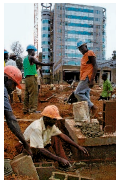
Baustellen dominieren Kigalis Stadtbild. Im Hintergrund der Glasturm einer südafrikanischen Bank

Vom warmen Willkommen für Investoren kündigt schon die „CIP“-Lounge für „Commercial Important Persons“ am Flughafen. „CIP“-Salons gibt es auch in unbeliebteren Ge- ▶