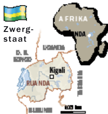
Das Binnenländchen in Ostafrika ist mit 26 334 km 2 etwa so groß wie Mecklenburg-Vorpommern