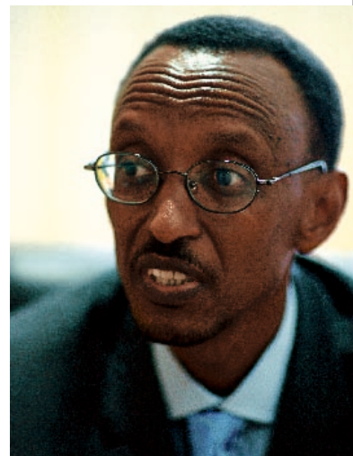
Paul Kagame, 50,

Ruandas Präsident Paul Kagame über die Weltpresse, Entwicklungshilfe und den Nutzen von Paris Hiltons Visite