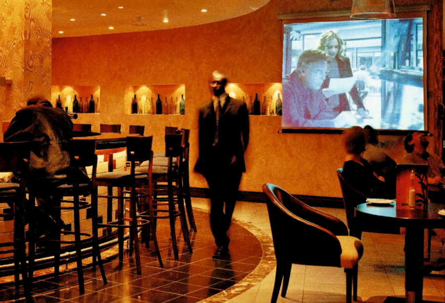
Business-Zentrale Im 5-Sterne-Hotel „Serena“, vorher „Interconti“, treffen sich Geldgeber, Geschäftemacher und Gutmenschen mit Ruandas Führungselite