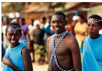
Rest von Folklore Traditionelle Tänzer in Kigali. Die Stadt feierte gerade 100. Geburtstag

ein autokratisches Regime vorwerfen. Ausländischen Investoren kommt das eher zupass. „Ich würde mir Sorgen machen“, sagt ein Unternehmer, der nicht genannt werden will, „würde Kagame nicht mit eiserner Hand regieren.“ Das Land gilt als sicher, und im Juli bescheinigte die Weltbank Kagames Führungsriege, sie zähle zu den am wenigsten korrupten Regierungen des Schwarzen Kontinents.