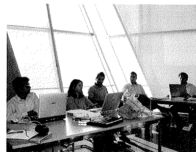
Studierende des Masterstudienganges Internationales Projektmanagement bei einer Case Study im Rahmen der Internationalen Projektwoche in Baltimore, USA, 2004

nationales Projektmanagement“ an, ein ausgereiftes Weiterbildungsangebot für die ganze Prozesskette Bauen, das diesen Paradigmenwechsel aufgreift. In Kooperation mit der John Moores-University, einer Business School in Liverpool, wird in einmaliger Weise ein Doppelabschluss Master of Engineering (bau- und immobilienbezogene Kompetenz) sowie Master of Business Administration (MBA: unternehmerische Kompetenz) vergeben. Der zeitliche Mehraufwand für den MBA-Abschluss beträgt dabei lediglich ein Semester.