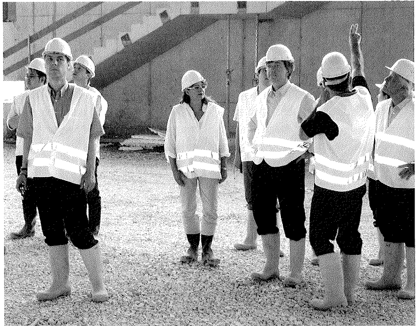
Studierende und Beiratsmitglieder des Studienganges Internationales Projektmanagement bei der Besichtigung der Baustelle der Neuen Messe in Stuttgart, 2006

mit ein. In sehr vielen Schwellenländern mit exponentiellem Wachstum gibt es einen eklatanten Mangel an Planungskompetenz im übergeordneten Sinne. Gerade für diese Länder ist die Kooperation von öffentlicher Hand und privaten Investoren von essentieller Bedeutung – bei oft sehr viel geringeren Berührungsängsten.