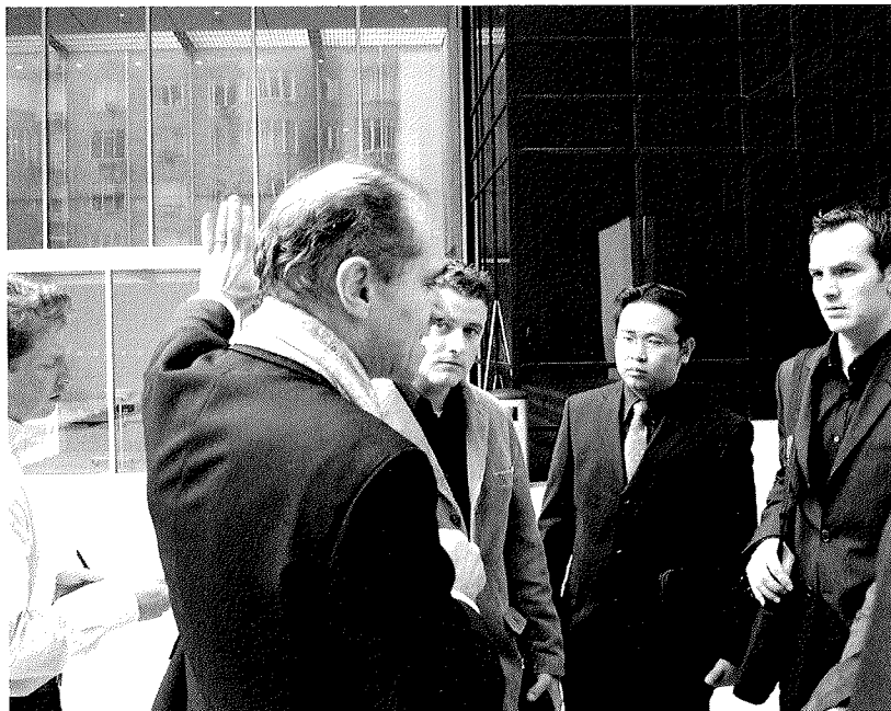
Studierende bei der Case Study des Museum of Modern Art in New York im Rahmen der Internationalen Projektwoche 2005

zu entwerfen, Zielgruppen zu identifizieren, Marketing- und Finanzierungsstrategien zu entwickeln, Chancen und Risiken zu erkennen, Investoren zu motivieren.